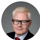
Яцек ЛЕГУТКО Jacek LEGUTKO (Kraków, PL) [online]

Актуальний стан надання кардіохірургічної допомоги в Україні при ургентній серцево-судинній патології Emergency Cardiac Surgery in Ukraine: Current Status